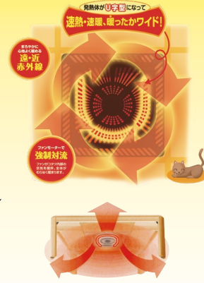
U形ハロゲンヒーター採用。 発光長54%UPでムラ無くあたたか!